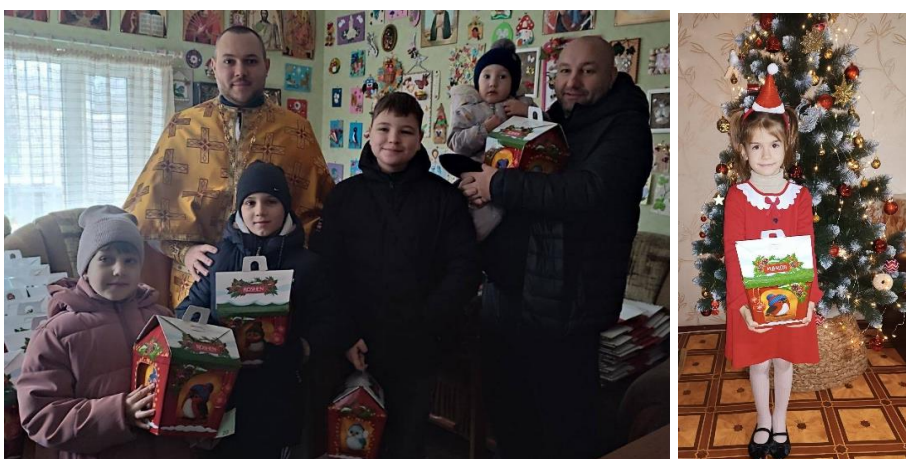
Tack vare ett samarbete med Föreningen svenskbyborna & direct Ukraine delades i dagarna julklappar ut till byns 350 barn, som idag är internflyktingar i området.

Byborna uttrycker en djup och återkommande tacksamhet för det stöd som ges. De insamlade bidragen, stora som små, gör konkret skillnad och möjliggör värme, mat, transporter, mediciner och hopp i en extremt svår situation. Och det mentala stödet från Sverige är oerhört viktigt för att känna att ett massivt stöd finns, som ger ett ljus i tunneln. "Vi håller ut – och vi tror på segern."