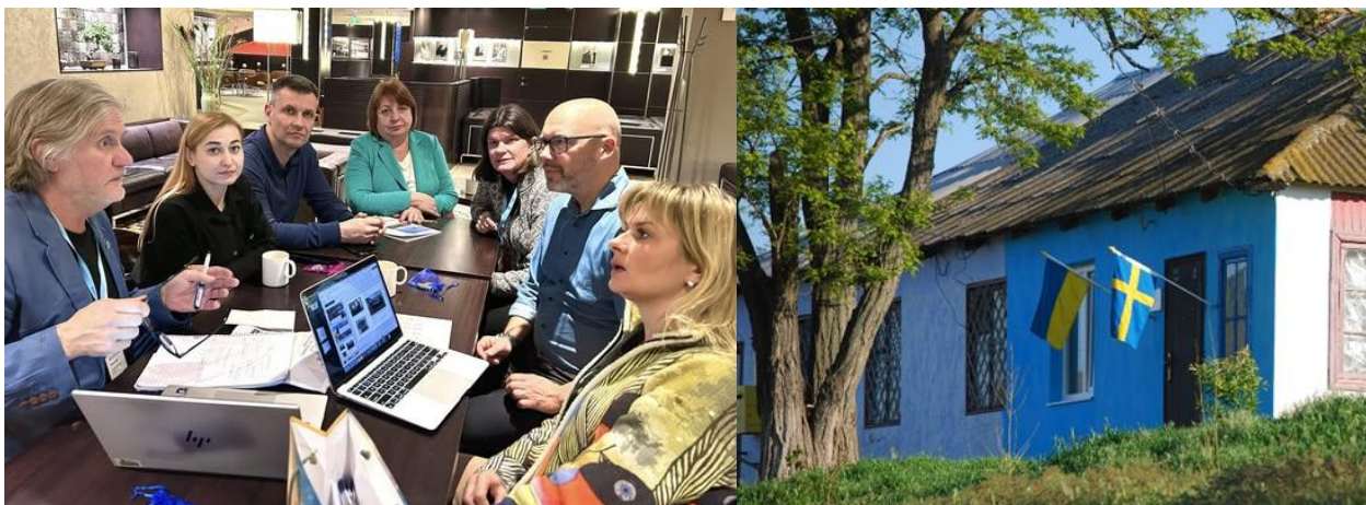
Arbetsmöte Gotland-Beryslav under ICLDs konferens i Tallinn i November.

Region Gotland och Beryslavs kommun har fått ett nytt ICLD-projekt beviljat. Region Gotland har haft ICLD-projekt med Gammalsvenskby sedan 2014. I detta projekt ska de arbeta med hur Beryslav med medborgardialog ska få invånarna, särskilt de unga, att återvända till Beryslavs kommun, med fokus på Gammalsvenskby/Zmijivka, samt få gotländska ungdomar att stanna eller återvända till Gotland med fokus på Roma. Det är ett rent kunskapsprojekt för att stärka den kommunala kapaciteten och förbereda för EU-inträde. Parterna träffades på en konferens i Tallinn i ICLDs nätverk för demokratisk resiliens. Tyvärr har det tagits beslut på att lägga ner ICLD, ett hårt slag för dessa viktiga kommunala partnerskap, som är viktiga för långsiktig utveckling.