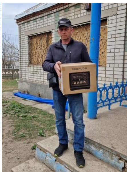
Briketter och ecoFlows har levererats under hösten.

För att möjliggöra nödhjälp, evakueringar och transporter har ett flertal bilar och transportfordon köpts in och levererats från Sverige. Visbys/Visbygymnasiets fordonsprogram har haft en viktig roll i att iordningställa fordonen inför leverans. Fordonen används nu intensivt i det humanitära arbetet, ofta under mycket stora risker. Och flera fordon vi levererat har förstörts. I november levererade Swedish Rescuers även en brandbil till Beryslavs brandvårn.