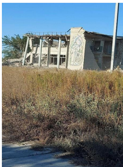
Kulturhuset under 240 årsjubileet 2011. Kulturhuset efter Rysslands bombning 2023.